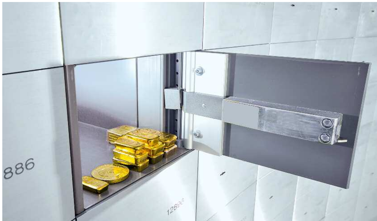
Goldbarren: Das Edelmetall kämpft mit Wertschwankungen – genauso wie andere Finanzanlagen

Wer sich dazu entschliesst, kann das Edelmetall in Form kleiner Barren bei einer Bank beziehen und beispielsweise in einem Tresor aufbewahren. 10 Gramm kosten rund 435 Franken, 100 Gramm 4284 Franken.