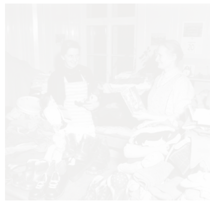
Seit 1936 ist die Winterhilfe Schweiz aktiv.