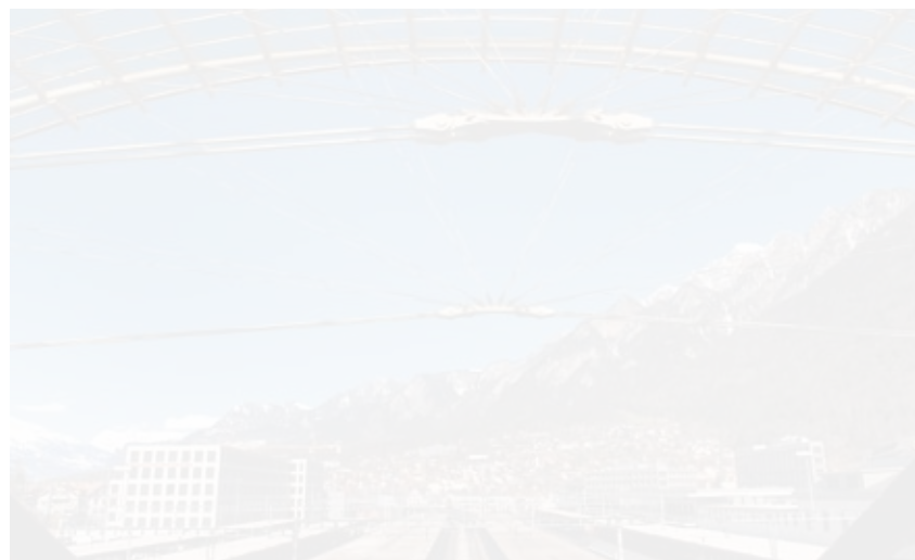
Der Bahnhof Chur erhält den Brunel Award.

Am 14. Oktober hat die renommierte Watford Group in Washington D.C. die 11. Internationalen Brunel Awards für herausragendes Eisenbahndesign und Architektur vergeben. Dabei hat die Jury mit den Bahnhöfen Brig und Chur, der elektrischen Zweifrequenz-Rangierlok und dem Lettenviadukt vier Projekte der SBB durch eine Brunel Commendation ausgezeichnet. Die Brunel Awards haben sich als bedeutendster Bauherren-Preis im Bahnsektor etabliert. Der Bahnhof Chur mit seinem Neurenaissance-Bahnhofsgebäude genügt trotz laufenden betrieblichen Anpassungen dem gestiegenen Verkehrsaufkommen von SBB und Rhätischer