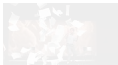
Szene aus «The Peace Syndrome».

Mit dem Thema «Grenzen sprengen» wurde am letzten Wochenende die neue Theatersaison am Theater Chur eröffnet. Schwerpunktthema war Israel/Palästina. Mit den zwei Eröffnungsinszenierungen «The Peace Syndrome» und «In der Strafkolonie» kamen zwei Erstaufführungen vor das Publikum. Weitere Aufführungen der Spielzeit 2011/2012 des Theaters Chur im Überblick