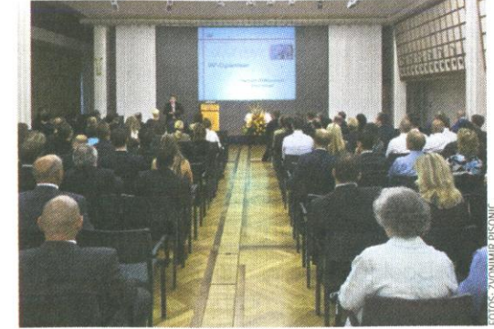
Rund 120 Absolventinnen und Absolventen «Dipl. Finanzberater/-in IAF» nahmen an der Preisverleihung im Kongresshaus Zürich teil.